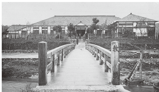
明治25年に現在地へ校舎移転

最後になりますが、大東小学校をここまで支えてくださった地域の皆様、PTAの皆様、行政の皆様、教職員の皆様に深く感謝申し上げるとともに、子どもたちの健やかな成長を祈ります。