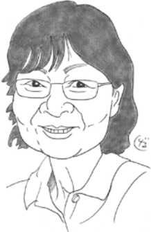
(絵:大東町東町北 細田 滋)